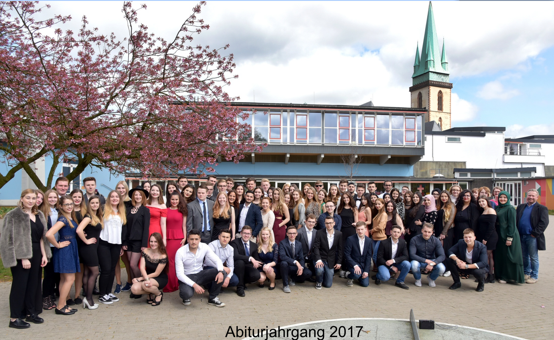
Abiturjahrgang 2017 während der Mottwoche auf dem Schulhof